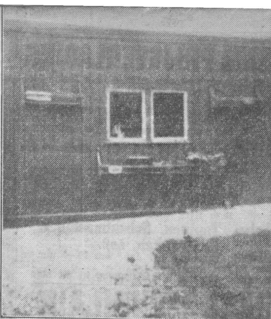
„Zo begon het.....”

...beslissende stimulators voor de initiatiefnemers geweest: dit contact is gebleven en de „ERRES” apparaten zijn thans overbekend. (De verkoop der van der Heem producten is n.l. thans geheel in handen van Stokvis). Het bleef groeien en panden werden gehuurd, voor het onderbrengen o.a. van de meubelmakerij en de afdeling metaalbewerking. Het op een bovenkamertje „geboren” gecombineerde wisselstroom-apparaat werd een doorslaand suc-