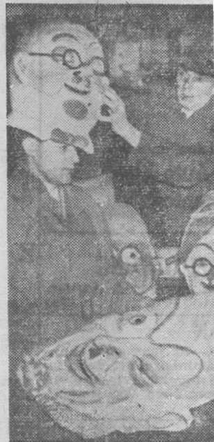
In Januari beginnen de valsfeesten. Het uitzoeken een passende „kop” is een lastig karwei.

Dank zij de uitstekende sociale voorzieningen van het duizenden man tellende personeel is Van der Heem N.V., de „deviezen-kwekerij” onder de Haagse rook, uitgegroeid tot een model-bedrijf in optima-forma.